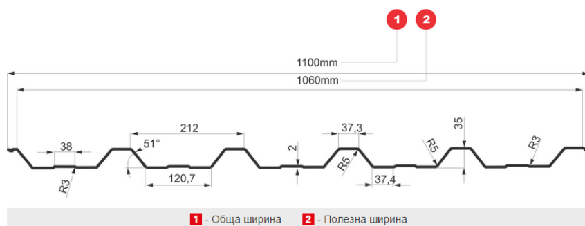
1 - Обща ширина 2 - Полезна ширина

- БИЛКА произвежда вълнообразни листове в 21 цветови варианта – матови и лъскави